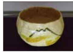
「富山」 三代教主さま