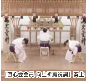
「直心会会員 向上祈願祝詞」奏上