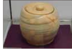
木ノ花桜灰釉水指 五代教主さま