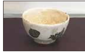
栗の絵 三代教主さま