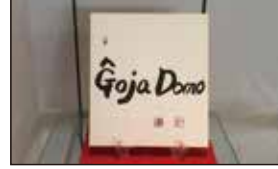
Goja Domo 五代教主さま