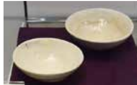
白重茶碗 三代教主様