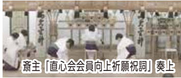
奏上「直心会会員向上祈願祝詞」