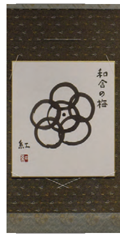
【作 品】五代教主さま 【作 品】和合の梅