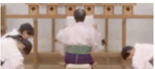
齋主「直心会会員向上祈願祝詞」奏上