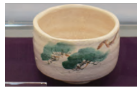
松ヶ枝文 金重陶陽造 松野奏風 絵