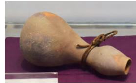
ふくべ花入 金重有邦