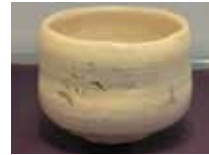
おきな 金重陶陽作 松野奏風絵