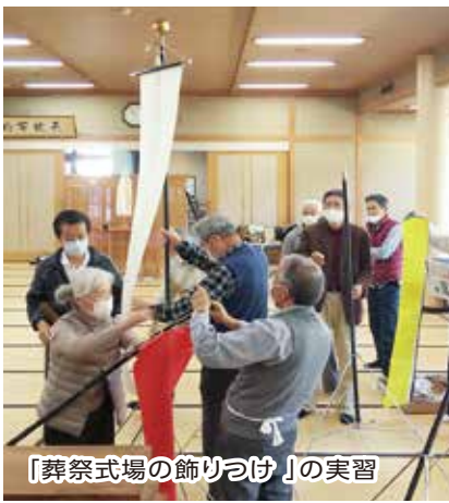
「葬祭式場の飾りつけ」の実習

講習会の中で「誄詞」は斎主が書くものであるが、「誄詞」が苦手な方は葬祭部で作ってもらう事も可能との事。また各自に本部で取り扱っている「エンディングノート」の利用を勧めている。