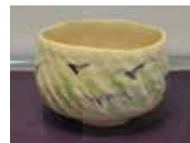
からす絵 三代教主様